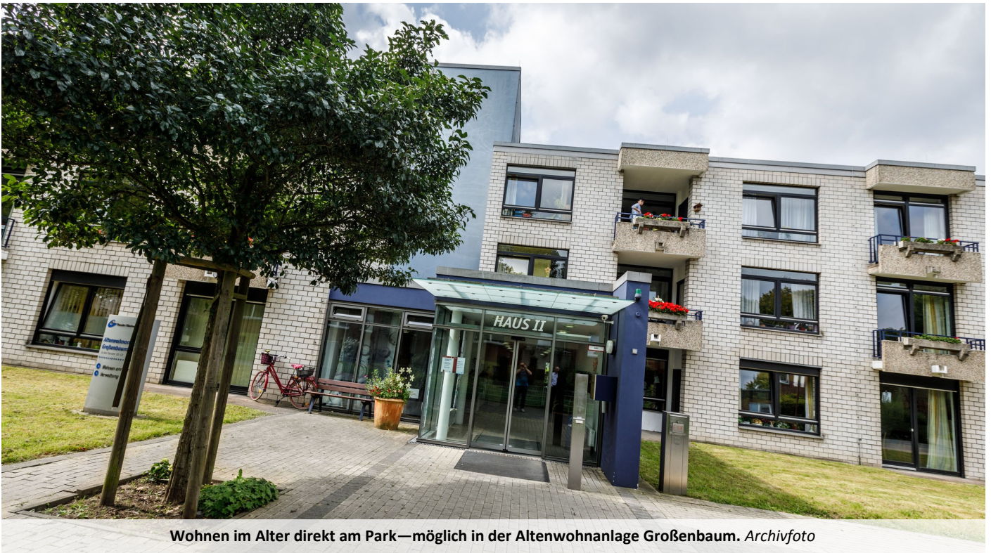
Wohnen im Alter direkt am Park—möglich in der Altenwohnanlage Großenbaum.

Beim Weinfest der Altenwohnanlage Großenbaum dreht sich vieles um die Traube